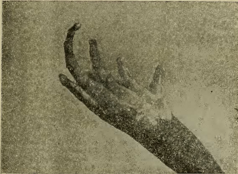
Figura N.º 5 — Vista da planta do pé do Holótipo